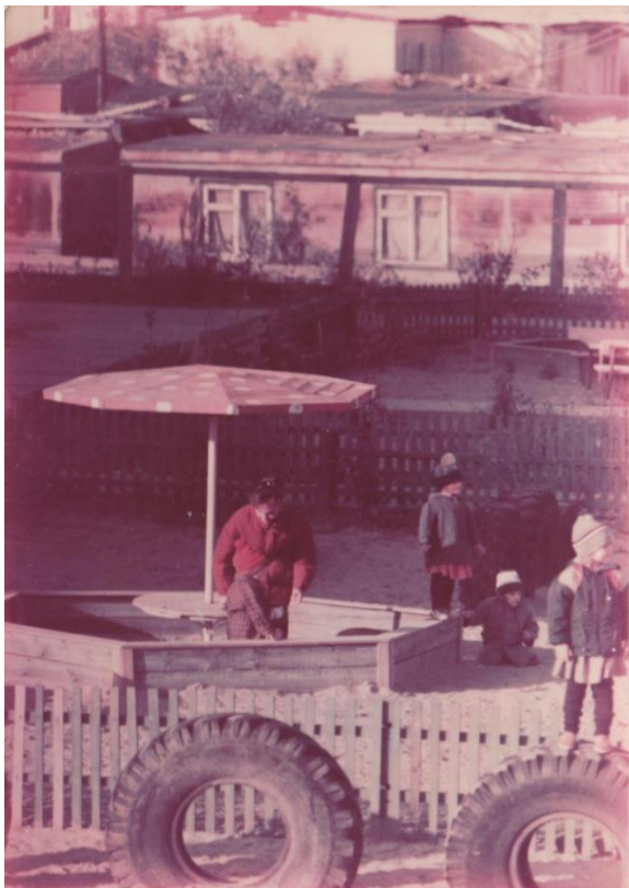
Игровая площадка детского сада «Северяночка»