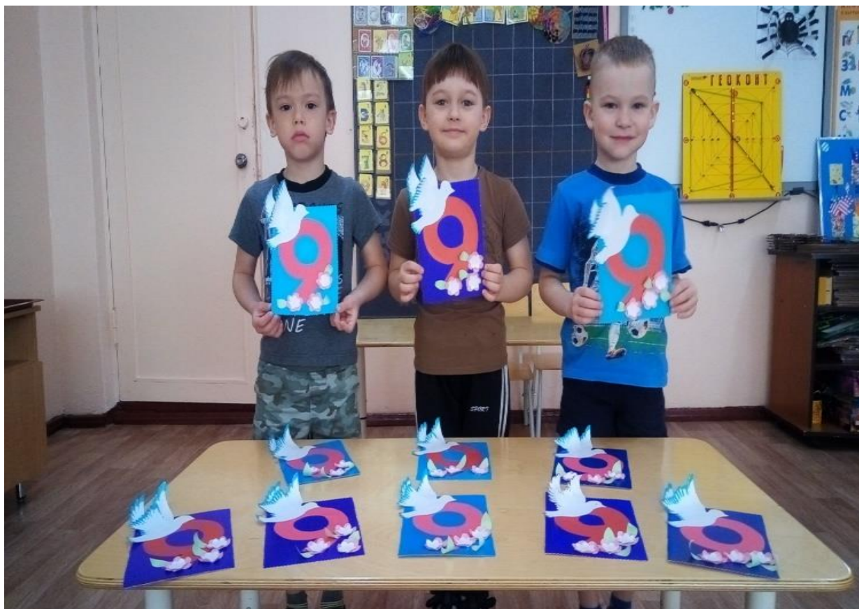
Открытки для ветеранов и тружеников тыла ко Дню Победы