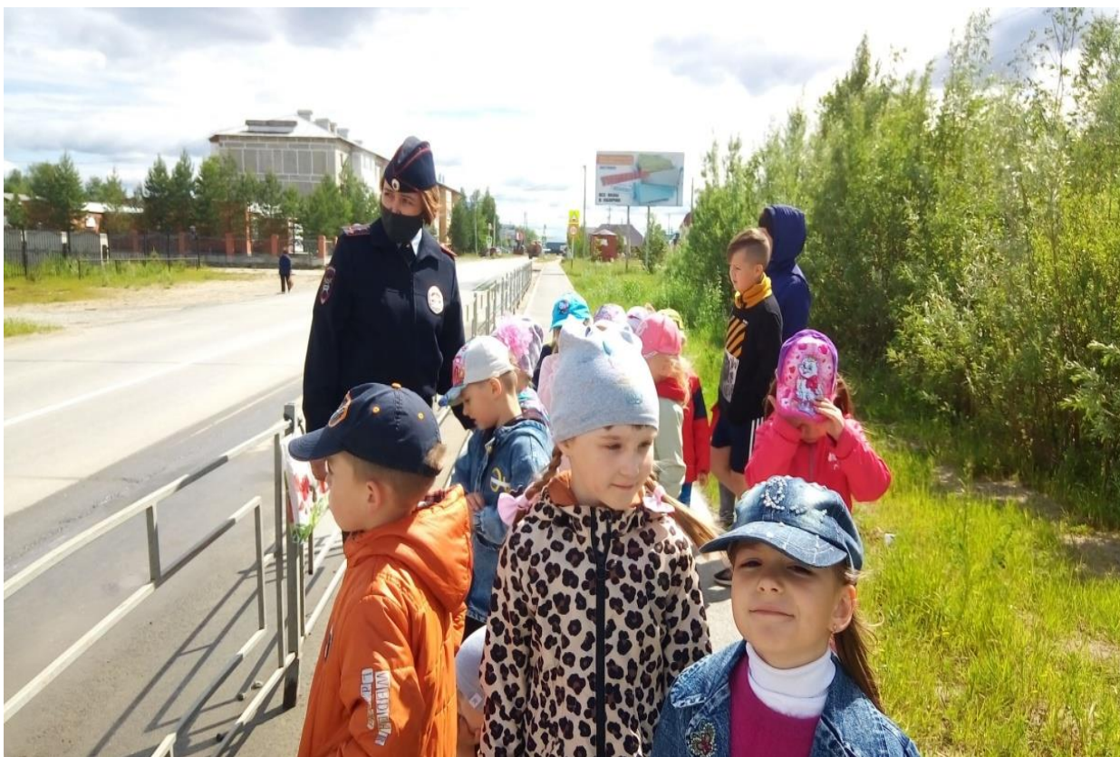
Экскурсия по улицам поселка Приобье с инспектором ГБДД