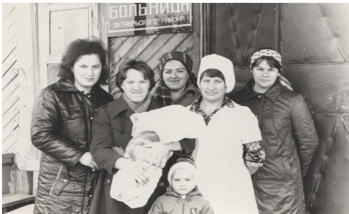
Старое здание больницы